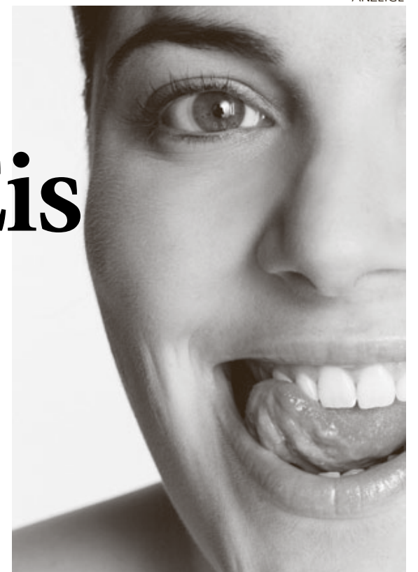
Die Zunge fühlt feinste Unebenheiten der Zähne

20 % künstlichem Zahnschmelz (Zink-Carbonat-Hydroxylapatit) mikrofeine Unebenheiten in der Zahnschmelzstruktur. Die Zähne fühlen sich glatter an, Bakterien können schlechter anhaften und die Bildung von Zahnbelag wird reduziert.